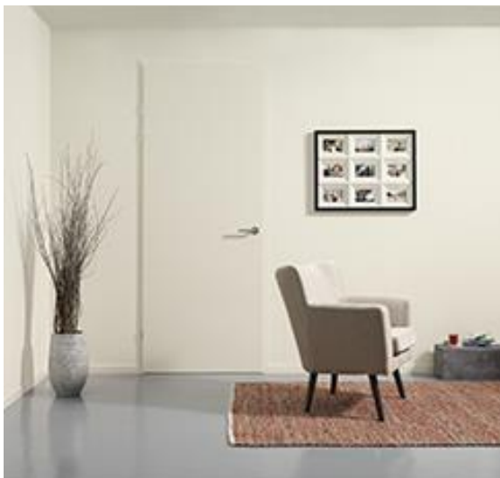
Opdekdeur zonder bovenlicht