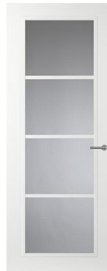
Design CN07 Binnendeur met Glas